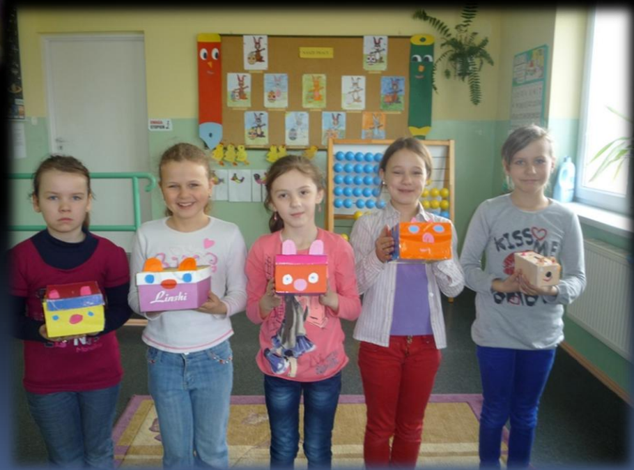
To nasze kartonowe skarbonki.